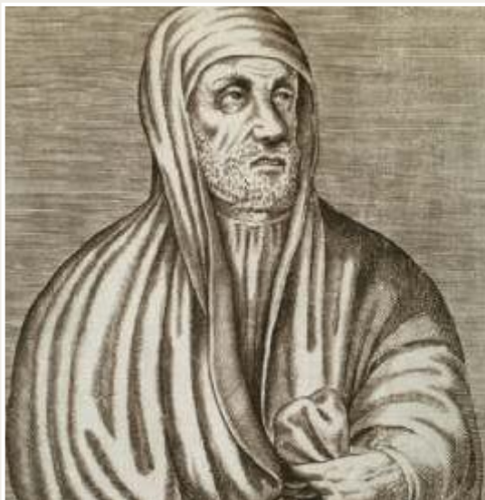
Ibn Sina 980 -1037