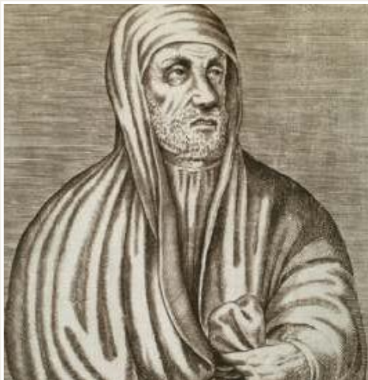
Ibn Sina 980 -1037