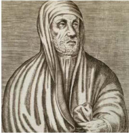
Ibn Sina 980 -1037